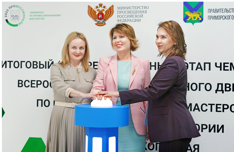
■ Открытие пространства федерального проекта «Профессионалитет»