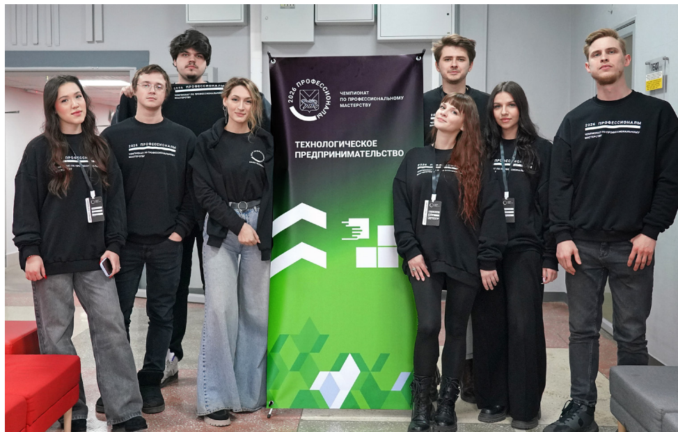
■ Региональный чемпионат «Профессионалы», компетенция «Технологическое предпринимательство»

Так, вебинар «ИИ для преподавателя: секреты эффективного диалога» собрал участников, которые оттачивали мастерство составления запросов. На вебинаре «Teach Smarter, Not Harder» преподаватели иностранных языков примеряли нейросети к своей специфике. Для преподавателей Академического колледжа провели отдельный очный цикл, посвященный проектированию электронных учебных курсов. Преподаватели освоили полный цикл создания электронного курса: от анализа рынка труда до системы оценивания.