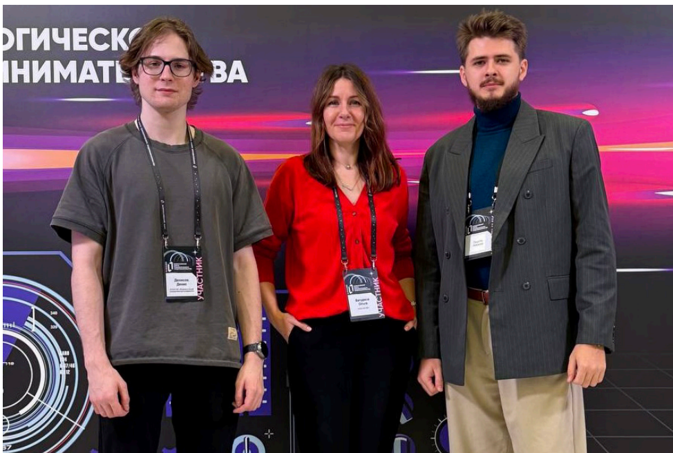
■ IV Всероссийский форум технологического предпринимательства

Студенты программы активно участвуют в реальных проектах под руководством преподавателей. Так, год назад они помогли разрабатывать мастер-план Спасского муниципального района. Итогом стал документ, который сегодня уже реализуется: он помог привлечь