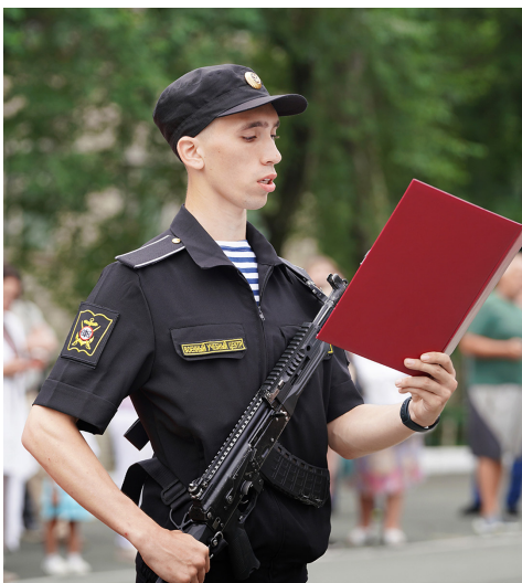
■ Присяга курсантов военного учебного центра ВВГУ

Эта государственная повестка подкрепляется конкретными шагами. В 2026 году в России утверждён трёхлетний план мероприятий по реализации Стратегии