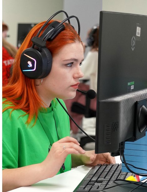
■ Чемпионат Профессионалы — от учебных кейсов до реальных проектов