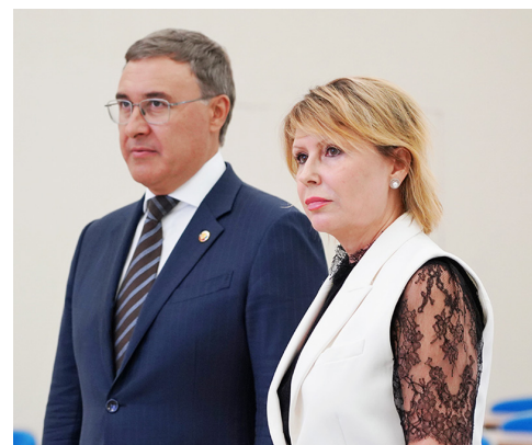
Визит министра науки и высшего образования РФ Валерия Фалькова в ВВГУ

За последние несколько лет университет добился впечатляющих успехов в подготовке кадров высшей квалификации. Действующая программа целевой подготовки кадров для университета позволяет аспирантам и сотрудникам успешно защищать диссертации — как кандидатские, так и докторские — по широчайшему спектру направлений: от экономики и права до технических наук и культурологии, и оставаться работать во Владивостокском государственном университете. Закономерным итогом этого роста стало открытие собственного диссертационного совета по экономическим специальностям — это право дано тем вузам, чей авторитет в