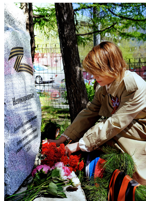
■ Цветы к монументу в память о военных подвигах земляков