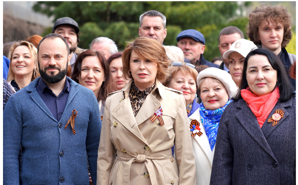
■ Поднятие знамени Победы в ВВГУ

ВВГУ сегодня — это стратегический партнер государства и бизнеса. Как резюмирует