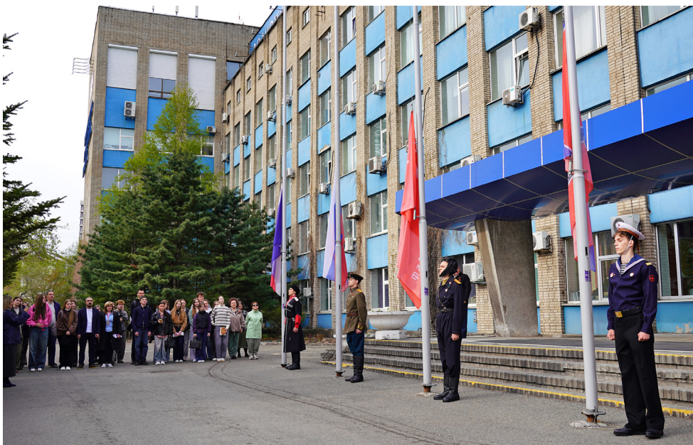
■ Поднятие Знамени Победы в ВВГУ

финансирование на инвестиционные проекты, а студентам предложили трудоустройство в администрацию района. И это не единственный случай. ВВГУ имеет успешный опыт написания стратегий развития Шкотовского муниципального района и Большого Камня — везде к работе привлекались студенты, применяя теоретические знания на практике и участвуя в создании муниципальных проектов.