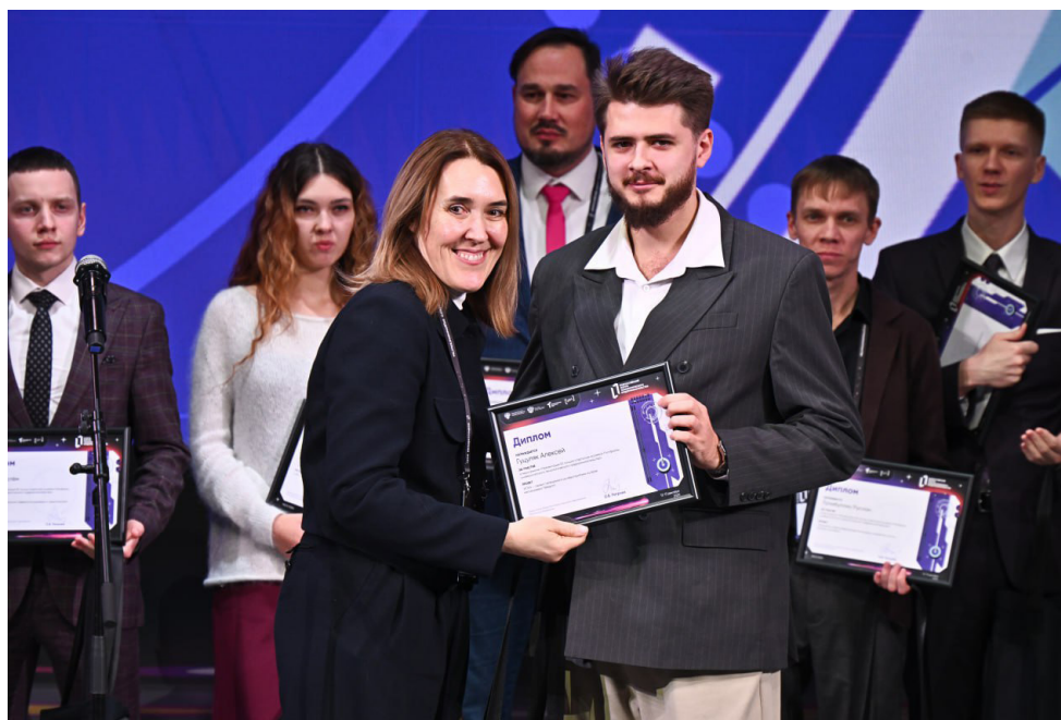
■ Проект студента ВВГУ — виртуальный финансовый тренажер FinApp — в топ-50 Всероссийского рейтинга

горизонты для развития молодежной науки ВВГУ и региона в целом.