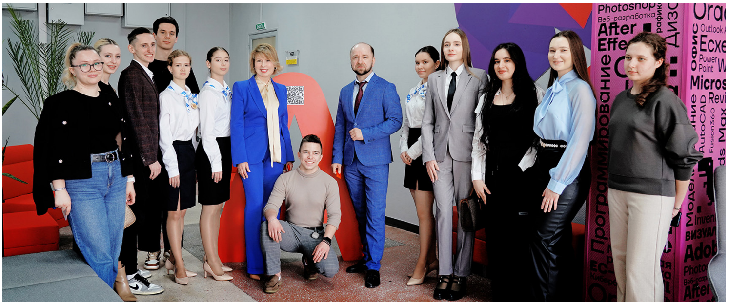
■ Открытие коворкинга «Альфа-Банк» в ВВГУ

«Говоря о развитии Владивостокского государственного университета, мы делаем особый акцент на трех флагманских программах, которые по праву можно назвать элитными: это подготовка кадров для сферы туризма и гостеприимства, а также для сферы государственного и муниципального управления, и для индустрии моды и красоты — это дизайнеры, — подчеркивает