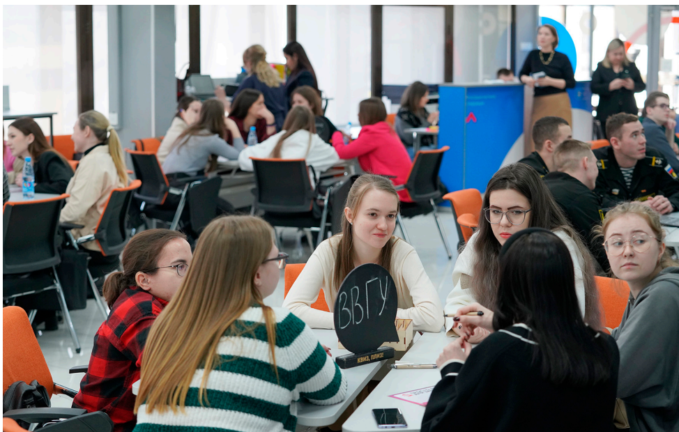
■ Квиз Сбербанка для студентов ВВГУ