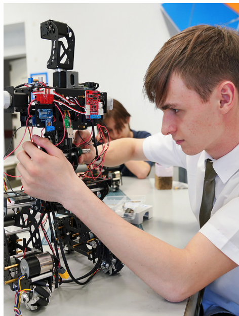
■ В студенческом конструкторском бюро «ЭвоТех» ВВГУ собирают и программируют роботов для промышленных партнеров вуза

(второй диплом о профпереподготовке). Это позволяет официально работать в индустрии уже во время учебы».