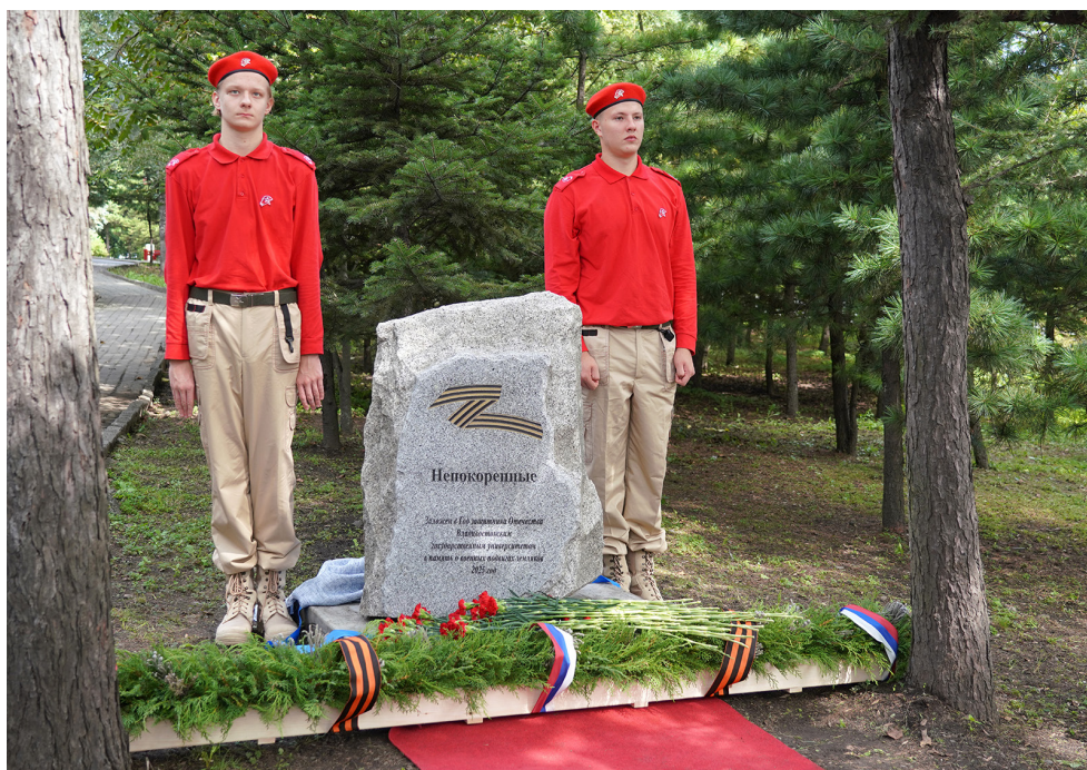
■ Юнармия у монумента «Непокорённые»