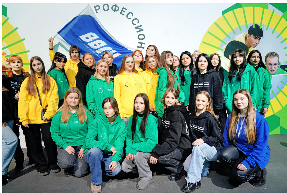
■ ВВГУ — официальная площадка итоговых межрегиональных чемпионатов «Профессионалы»

Реализуя государственные программы, развивая кадровый потенциал и укрепляя связь с РАН, ВВГУ доказывает: статус «опоры национальных проектов» здесь носят не как звание, а как высокую ответственность.