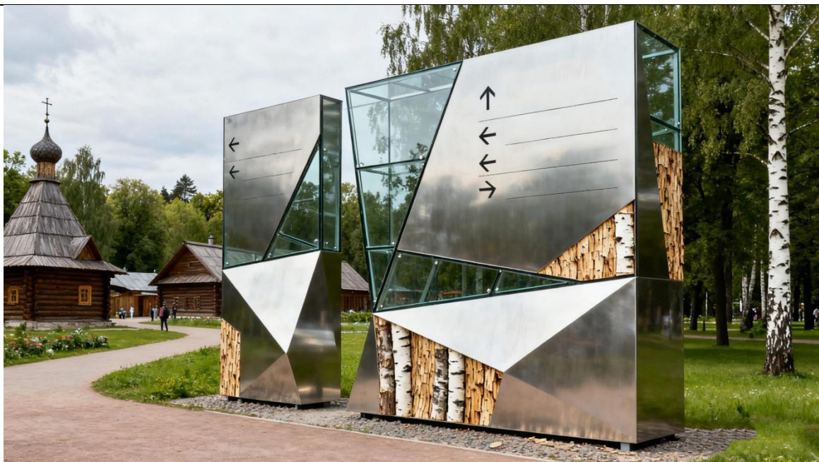
Применение элементов русского национального искусства при создании системы визуальных коммуникаций. Навигация