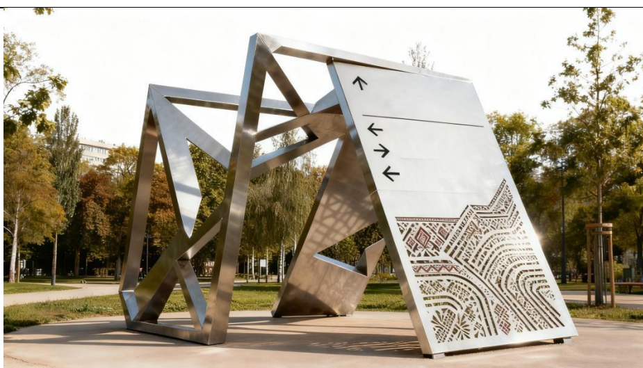
Применение элементов русского национального искусства при создании системы визуальных коммуникаций. Малые формы