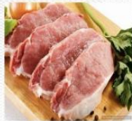
猪肉 [zhū ròu] свинина