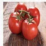
西红柿 [xī hóng shì] помидор