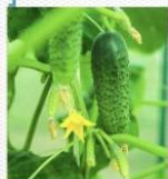
黄瓜 [huáng guā] огурец