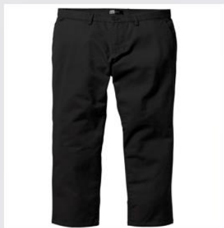
Брюки 裤子 【Kù zi】