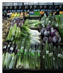
蔬菜区 [shū cài qū] овощная зона