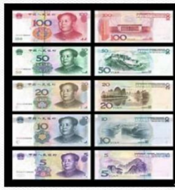
现金 [xiàn jīn] Наличные

水果区: [shuǐ guǒ qū] 新单词[xīn dān cí] фруктовая зона: