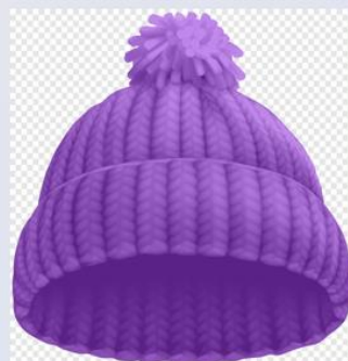
шапка 帽子 【Màozi】