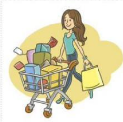
покупатель 买方 [mǎi fāng ]