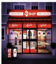
商店 [shāng diàn] магазин