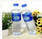
水 [shuǐ] вода