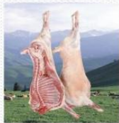
羊肉 [yáng ròu] баранина