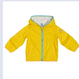
куртка 夹克 【Jiá kè】