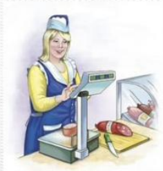
Продавец 卖方 [mài fāng ]