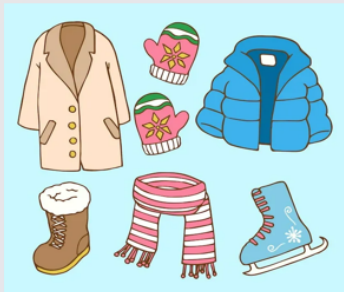
одежда 衣服 【yīfú】