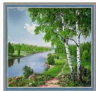
Дерево 树 【Shù】