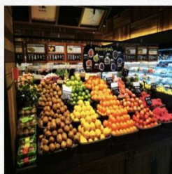
水果区 [shuǐ guǒ qū] фруктовая зона