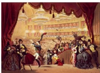
Драма 戏剧 【xìjù】