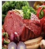
牛肉 [niú ròu] говядина