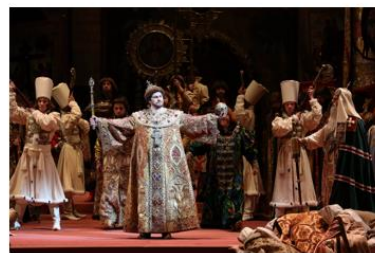
Опера 歌剧 【gējù】