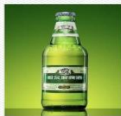
啤酒 [pí jiǔ] пиво