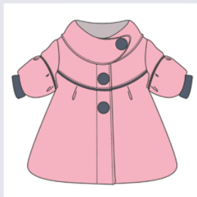
пальто 外套 【wàitào】