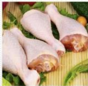
鸡腿 [jī tuǐ] ножка