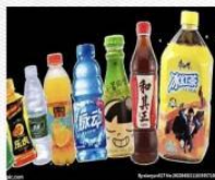
饮料 [yǐn liào] напиток