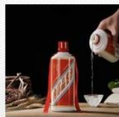
白酒 [bái jiǔ] водка