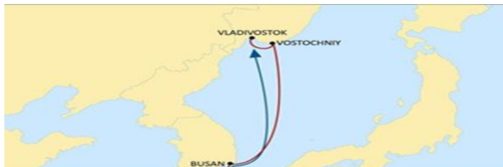
Базовая схема работы грузоотправителей с линией ONE