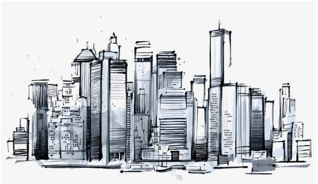
Работа с цветом: передача фактур (кирпич, стекло, бетон), настроения.