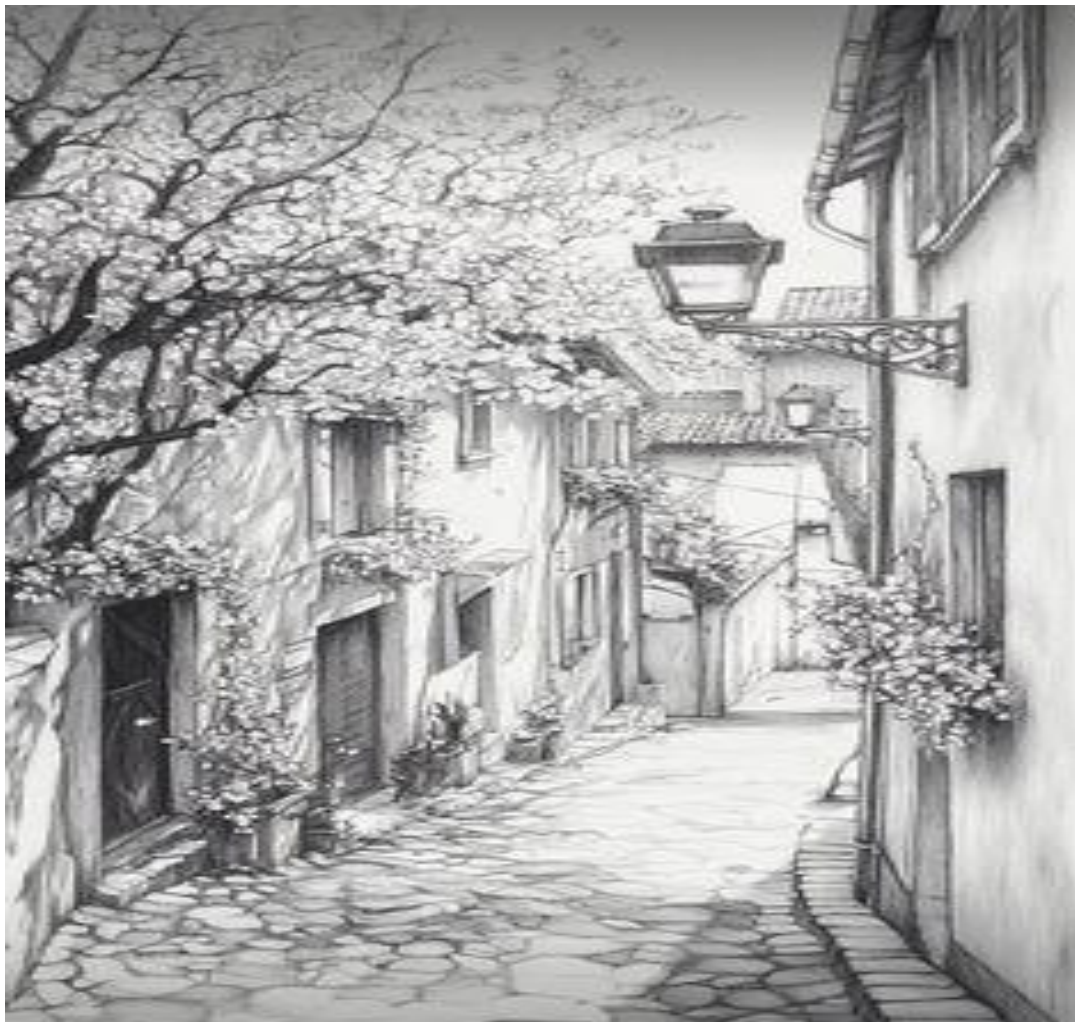
Рисунок городского элемента (дом, окно, фонарь) с натуры и по памяти.