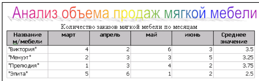
Рис. 10.2. Результат выполнения