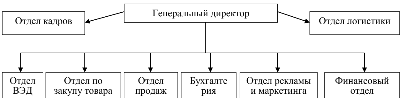
Рисунок 1.3 – Организационная структура ООО «Востокшинторг» в 2020 г.

При ссылках на иллюстрации следует писать «... в соответствии с рисунком 2» при сквозной нумерации и «... в соответствии с рисунком 1.2» при нумерации рисунка в пределах раздела.