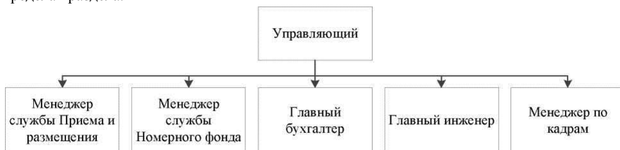
Рисунок 1.3 – Организационная структура ООО «Гостиница», 2020 г.

При ссылках на иллюстрации следует писать «... в соответствии с рисунком 2» при сквозной нумерации и «... в соответствии с рисунком 1.2» при нумерации рисунка в пределах раздела.